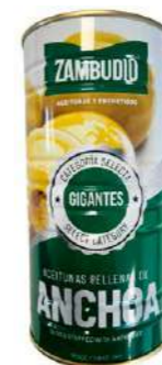
501015 Olives farcides anxova gegants 140/200 6 X 600 GRs. ZAMBUDIO 5,39 € / unit.