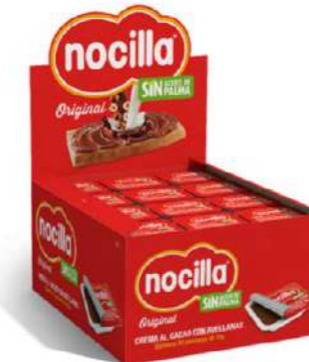
601607 Nocilla porció individual 72 X 15 GRs. IDILIA 10,38 €/caixa 0,15 €/porció