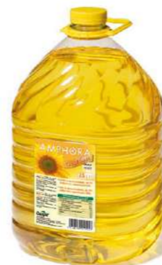
160802 Oli gira-sol Gold 2 X 7,5 LIT. AMPHORA 1,88 € / litre