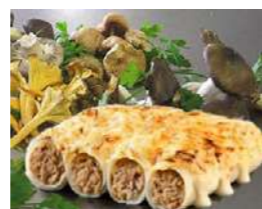
050847 * Caneló bolets 100 X 50 GRs. SALT DEL SALLENT 61,00 € / caixa 0,61 € / unit.