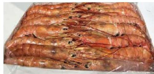
010535 * Escamarlà n° 4 26/35 4 X 1,5 KGS. 7,65 € / kg. 0,30 € / unit.