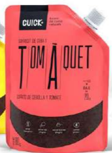
502011 Sofregit de ceba i tomàquet 6 X 160 GRs. CUICK 3,56 €/unit.