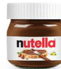
601577 Nutella pot vidre 64 X 25 GRs. NUTELLA 31,36 €/caixa 0,50 €/unit.