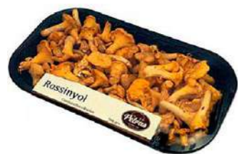
080897 * Rossinyol sencer 5 X 1 KG. PETRAS 9,25 € / kg.