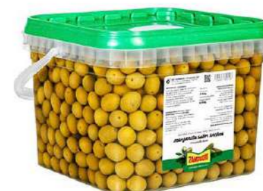
501009 Olives manzanilla 160/200 446-R 2600 GRs. ZAMBUDIO 13,75 € / unit.