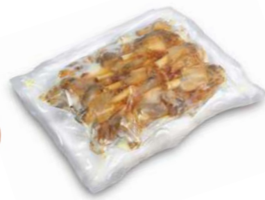
500924 Manchons d'âne confit 16 unit. 4 BOSSES ROUGIE 13,65 €/bossa