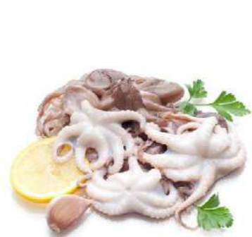
020727 * Popets 26/40 6 X 800 GRs. (PES NET) 6,95 € / bossa