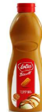
601999 Biscoff Topping 8 X 1 KG. LOTUS 7,97 €/pot