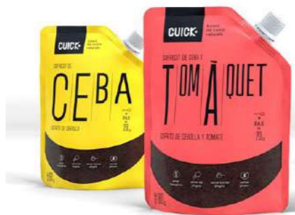
502010 Sofregit de ceba 6 X 160 GRs. CUICK 3,56 €/unit.