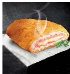
051010 * "Cordón Bleu" gall dindi 40 X 125 GRs. APROX. ARRIVE 5,95 € / kg. 0,74 € / unit.