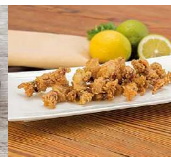
050859 * Puntilla enfarinada 2 KGS. I.Q.F. P.C.S. 10,25 € / kg.