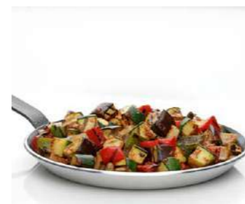
080859 * Samfaina "pisto" verdures fregides 4 X 2,5 KGS. J.V. 3,65 € / kg.