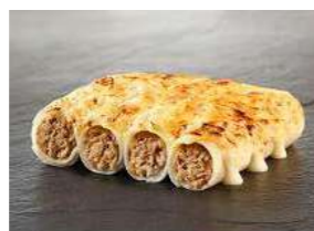
050844 * Caneló artesà 50 X 48 GRs. SALT DEL SALLENT 25,50 € / caixa 0,51 € / unit.