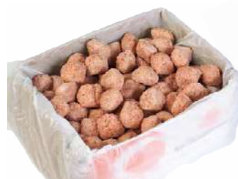
171512 * Mandonguilles mixtes 100 X 30 GRs. GICARNS 4,67 € / kg. 0,14 € / unit.