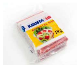
010529 * Surimi de mar "tronquito" 5 X 1 KG. KRUSTASUR 7,15 € / kg.