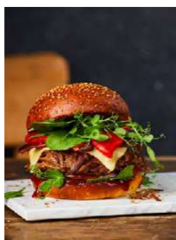
171521 * Ànec burger carn confit 100 grs. aprox. 4 X 6 UNIT. ROUGIE 28,50 € / kg. 2,85 € / unit.