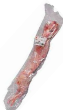
171570 * Conill jove sencer 1 / 1,1 KGS. 6,95 € / kg.