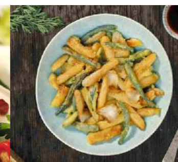
050750 * Verdures tempura selecció 6 X 1 KG. FÍNDUS 7,79 € / kg.