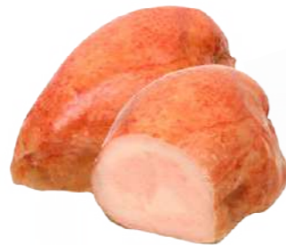
525006 Pit gall dindi natural al forn 2,5 KGS. CUI'S 12,70 €/kg.