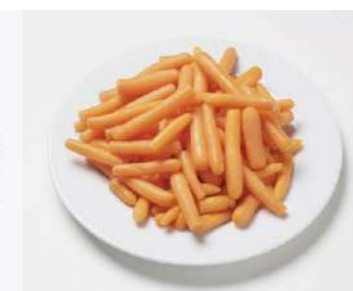
080815 * Pastanaga extra baby (6/14 mm) 4 X 2,5 KGS. GREEN'S 1,85 € / kg.