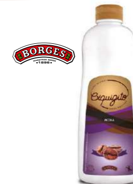
600440 Xarop "sirope" moka 6 X 1 LITRE BORGES 5,52 €/unit.