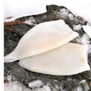
020781 * Calamar tub Illex +22 cm. (20% glaç) 5 KGS. INTERFOLIAT 7,15 € / kg.