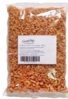
523003 Ceba fregida cruixent 10 X 500 GRs. STA. RITA 3,12 €/unit.