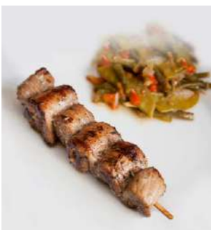
171538 * Broqueta porc 6 talls 5 SAF. X 10 UNITS. LA BROQUETA DE L'EMPORDÀ 41,00 € / caixa 0,82 € / unit.