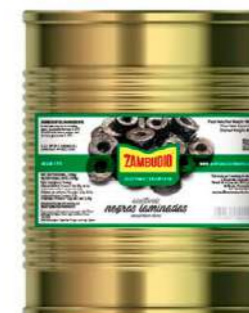
501013 Olives negres laminades A-10 3 X 1560 GRs. ZAMBUDIO 10,05 € / unit.