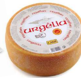
506005 Formatge Urgèlia DOP 2 X 2,5 KGS. CADI 12,97 € / kg.