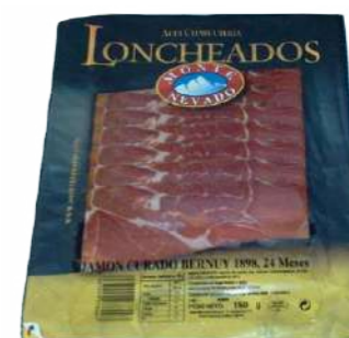
560023 Pernil serrano llescat 30 X 100 GRs. MONTENEVADO 3,05 € / unit.