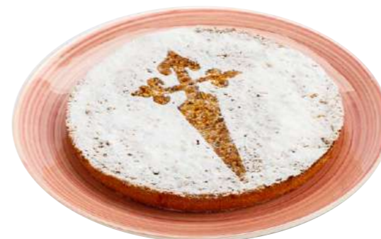
600237 Pastís Santiago 12 X 800 GRs. LAMASTELLE 10,11 €/unit. 0,84 €/porció