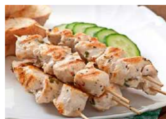
171537 * Broqueta pollastre 6 talls 5 SAF. X 10 UNITS. LA BROQUETA DE L'EMPORDÀ 41,00 € / caixa 0,82 € / unit.