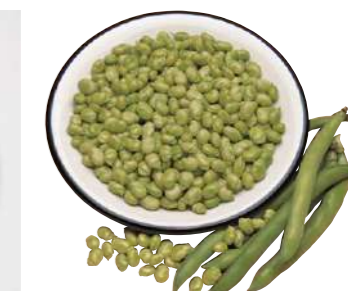
080827 * Faves baby 5 X 1 KG. J.V. 3,95 € / kg.