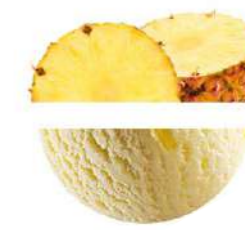
600171 Sorbet pinya 2,5 LITRES 24,99 €/unit.