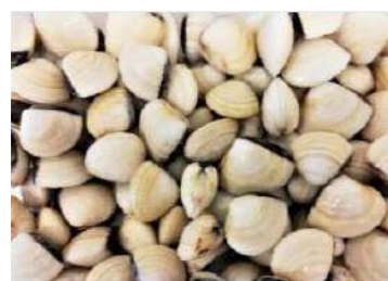
010607 * Cloïssa blanca Vietnam 60/80 6 X 1 KG. ARTICFISH 2,15 € / kg.