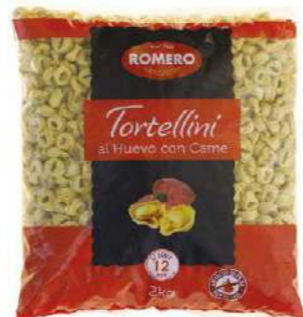
535121 Tortellinis de carn 2 KGS. ROMERO 3,80 €/kg. NOVETAT