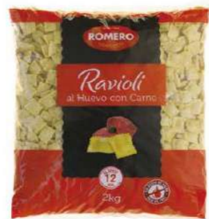
535120 Raviolis de carn 2 KGS. ROMERO 3,80 €/kg. NOVETAT