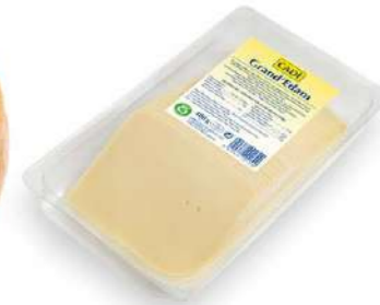
506006 Formatge Edam llescat 10 X 400 GRs. CADI 4,16 € / unit.