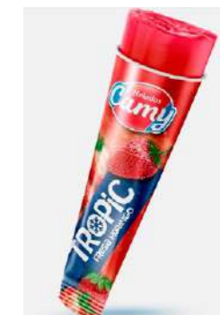
601322 Tropic maduixa 24 X 110 ML. CAMY 22,03 €/caixa