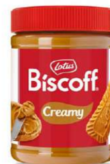
601998 Biscoff Spread (crema) 4 X 1,6 KGS. LOTUS 12,62 €/pot