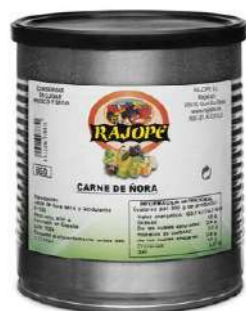
500250 Carn de nyora 12 X 830 GRs. RAJOPE 4,65 €/unit.