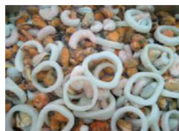
010563 * Sopa marisc Xile (0% glaç) 5 KGS. I.Q.F. P.C.S. 6,45 € / kg.