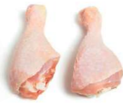
171528 * Pollastre "jamonots" 130/170 grs. 5 KGS I.Q.F. BONCHEF 3,45 € / kg. 0,50 € / unit.