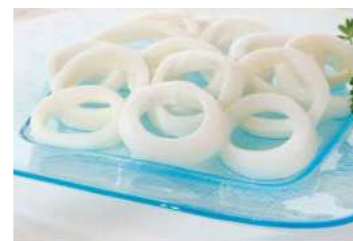
020881 * Pota anella extra (35% glaç) 5 KGS. I.Q.F. SILOMAR 8,85 € / kg.