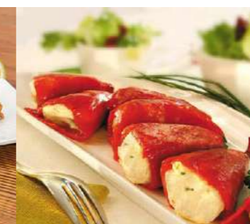
050821 * Pebrot piquillo bacallà 60 grs. aprox. 3 KGS. I.Q.F. GORENA 7,15 € / kg. 0,43 € / unit.