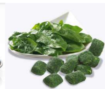
080305 * Espinacs porcions 4 X 2,5 KGS. MIAS 1,50 € / kg.