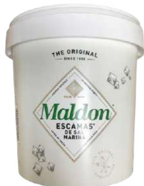
527001 Sal Maldon 6 X 570 GRs. 8,50 €/unit.