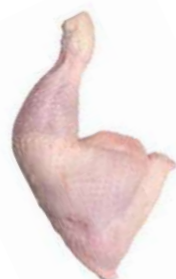
171515 * Pollastre cuixa 200/300 grs. 5 KGS I.Q.F. BONCHEF 3,25 € / kg. 0,82 € / unit.