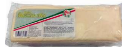
560919 Mozzarella barra 4 X 2,38 KGS. 7,45 € / kg.