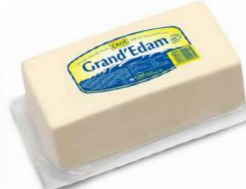
506002 Formatge barra Gran d'Edam 6 X 2,75 KGS. CADI 6,15 € / kg.