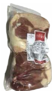
171529 * Ànec cuixes 380/400 grs. 4 KGS. APROX. (ENV. AL BUIT) ROUGIE 6,75 € / kg.