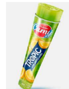
601321 Tropic llimona 24 X 110 ML. CAMY 22,03 €/caixa