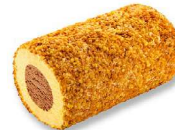
600312 Bloc de crocanti 8 X 575 GRs. GLAÇ 9,73 €/unit.