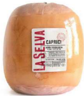
500663 Pernil cuit extra Caprici 8 KGS. LA SELVA 10,08 €/kg.