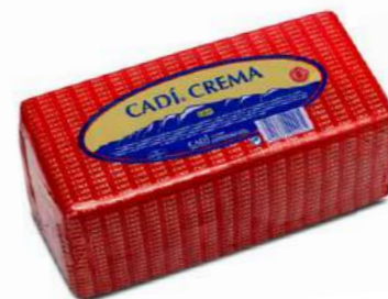
506001 Formatge cera "crema" 6 X 2,75 KGS. CADI 9,35 € / kg.