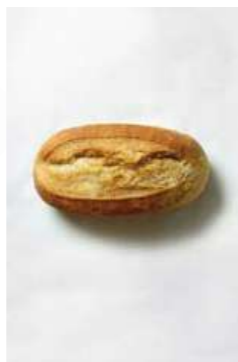
100002 * Panet chef 115 X 65 GRs. BELLSOLÀ 24,15 € / caixa 0,21 € / unit.