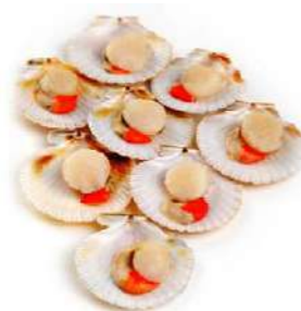
010622 * Vieira 1/2 clova 20/30 Xile (0% glaç) 8 X 1 KG. EUROPAÇIFICO 18,25 € / kg. 0,73/0,65 € / unit.