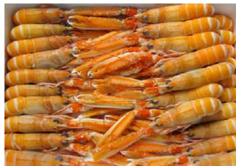
010534 * Escamarlà n° 3 21/25 4 X 1,5 KGS. 9,95 € / kg. 0,45 € / unit.