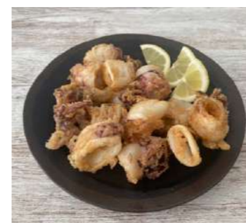
050817 * Calamar trossos enfarinat Premium 2 KGS. I.Q.F. P.C.S. 10,39 € / kg.