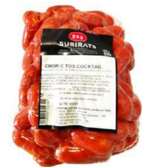
560109 Xoricets còctel 5 X 1 KG. SUBIRATS 8,55 € / kg.