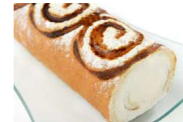
600298 Braç de nata artesà 6 X 500 GRs. GLAÇ 10,95 €/unit.