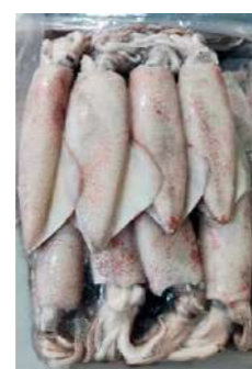
020747 * Calamar indi nat. 6/10 extra 6 X 2 KGS. ENTUBAT 9,15 € / kg.