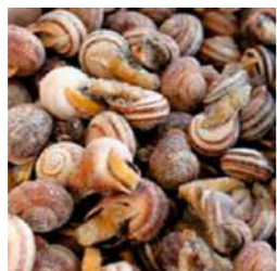
140807 * Cargol bover M 4 X 2,5 KGS. 9,95 € / kg.