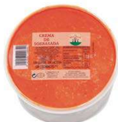
560453 Sobrassada crema 3 X 1 KG. EL MOLINAR 8,42 €/kg.