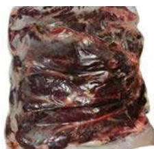
171564 * Vedella entrama gruixuda Import. 1,7 KGS. APROX. (ENV. AL BUIT) 12,50 € / kg.