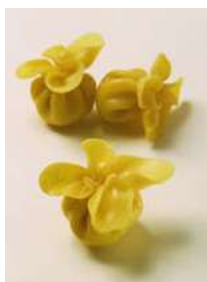
050706 * Fagotti al formaggio e pere 12 grs. 3 KGS. I.Q.F. 35% RENDIMENT CANUTI 34,50 € / caixa 1,15 € / ració