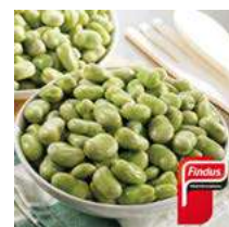
081007 * Faves baby 6 X 1 KG. FINDUS 3,90 € / kg.