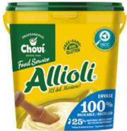
512100 Salsa alloli 4 X 2000 ML. CHOVI 4,68 € / litre