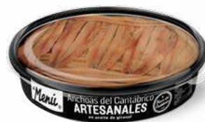
519003 Filet anxova del nord papallona en oli 6 X 80 FILETS. EL MENÚ 23,90 €/unit.