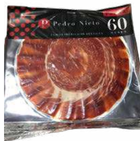
500470 Pernil ibèric 100% gla (tallat a ma) 80 GRs. PEDRO NIETO 12,35 €/unit.