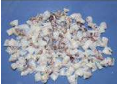
020855 * Calamar trossos indi 6 X 800 GRS. ALDUS 4,70 €/ bossa