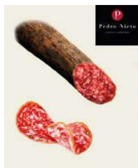
500467 Llonganissa ibèrica gla meitats 20 X 500 GRs. PEDRO NIETO 20,60 €/kg.