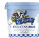
600670 logurt natural 1,28 €/unitat