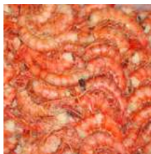
010537 * Gamba llistada cua n° 2 100/150 14 X 1 KG. PESCANOVA 29,75 € / kg.