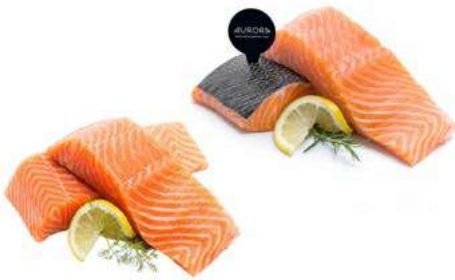
030819 * Salmó llong noruec sense pell 24 X 125 GRS. AURORA 2,50 €/ unitat