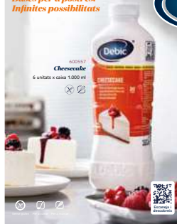
600557 Base de Cheesecake 6 X 1 LITRE DEBIC 6,63 €/litre