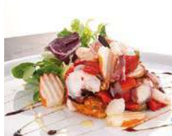
010587 * Salpicó maris 2 X 1 KG. P.C.S. 8,70 € / kg.