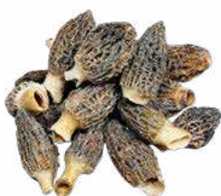
080899 * Múrgola 3 X 1 KG. PETRAS 19,25 € / kg.