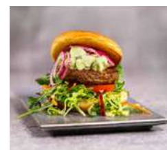
171650 * Burger Green Cuisine (0% carn) VEGAN 20 X 100 GRs. FINDUS 7,90 € / kg. 0,79 € / unit.