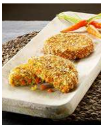
050341 * Crujiburger pastanaga 100 grs. 3 X 1 KG. PRIELA 7,00 €/ kg. 0,70 €/ unit.