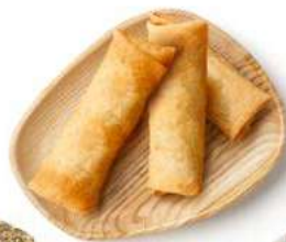
050307 * Rotllet primavera 20 X 50 GRS. BECKERS 6,20 €/ caixa 0,31 €/ unit.