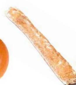
100825 * Pa de coca 20 X 375 GRs. NEVATERIA 1,95 € / unitat