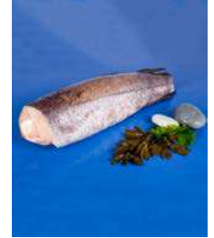
030788 * Lluç sencer austral nº 5 2,4/3,5 KGS. / PEÇA FRIOSUR 8,00 €/ kg.