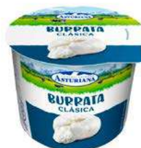
506100 Burrata clàssica 6 X 125 GRs. LA ASTURIANA 1,89 €/unit.