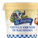
600674 Vainilla i nous macadàmia 1,28 €/unitat