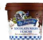
600675 Xocolata negra 1,32 €/unitat

Bases per a postres. Infinites possibilitats