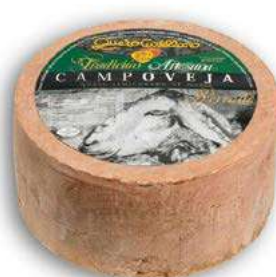
511000 Formatge semi 2 X 3 KGS. CAMPOVEJA 16,68 €/kg.