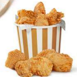
050325 * Pollastre contracuixa a l'estil Kentucky 3 X 1 KG. PRIELA 10,00 €/ kg.