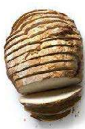
100035 * Pa de pagès tallat (12/15 llesques) 8 X 800 GRs. BELLSOLÀ 31,60 € / caixa 3,95 € / unit.