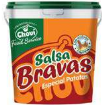
512102 Salsa brava 6 X 1000 ML. CHOVI 6,30 € / unit