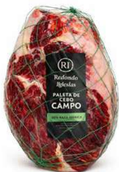
500501 Centre espatlla ibèrica Cebo Campo selecció 4 X 2,5 KGS. REDONDO IGLESIAS 37,80 €/kg.