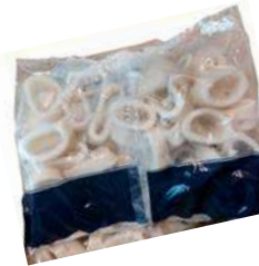
408231 * Pota anella (10% glaç) 5 X 1 KG. I.Q.F. ALFRIO 9,75 €/ bossa