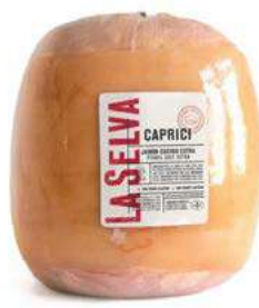
500663 Pernil cuit extra Caprici 8 KGS. LA SELVA 9,99 €/kg.