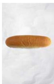
100017 * Pa de frankfurt acabat 54 X 70 GRs. BELLSOLÀ 23,22 € / caixa 0,43 € / unit.