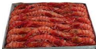
010565 * Gamba llistada A-A 48/52 12 X 1 KG. APROX. 3 CARABELAS 31,75 € / kg.