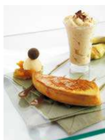
171552 * Foie escalopí 40/60 grs. 2 X 1 KG. APROX. ROUGIE 54,90 € / kg.