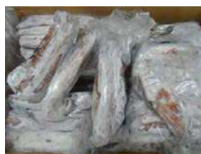
020715 * Calamar Marroc 2P (embolicat) 5 KGS. 11,75 € / kg.