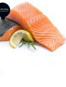
030837 * Salmó llong noruec amb pell 28 X 180 GRS. AURORA 3,25 €/ unitat