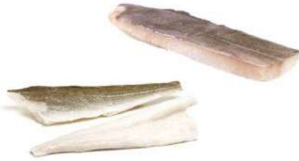
030751 * Bacallà filet +1000 grs. (1ª congelació) 11 KGS. I.Q.F. ICELANDIC 14,00 €/ kg.