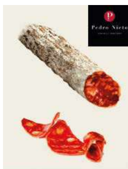
500466 Xoriço ibèric gla meitats 20 X 500 GRs. PEDRO NIETO 20,60 €/kg.