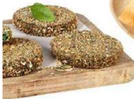
050339 * Crujiburger espinacs 100 grs. 3 X 1 KG. PRIELA 7,00 €/ kg. 0,70 €/ unit.