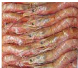
010518 * Gamba llagostinera n° 2 20/30 (bord 2025) 6 X 2 KGS. NOS 11,75 € / kg.