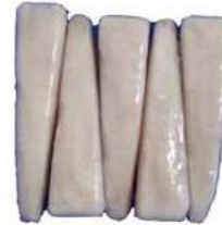
030884 * Rap xinès filet 150/200 grs. (25% GLAÇ) 5 X 1 KG. I.Q.F. 4,90 €/ bossa