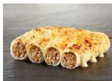
050844 * Caneló carn artesà 50 X 48 GRs. DISPUIG 25,50 € / caixa 0,51 € / unit.