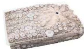
020701 * Pop cru 3/4 kgs. (0% glaç) 3/4 KGS. PEÇA MOYSEAFood 13,80 € / kg.