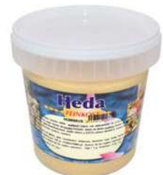
572660 Hummus clàssic 4 X 1 KG. HEDA 6,65 € / unit.