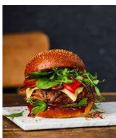
171521 * Ànec burguer carn confitada 100 grs. 4 X 6 UNITS. ROUGIE 27,30 € / kg. 3,00 € / unit.