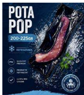
513265 Pop cuit 1 pota 180/260 grs. 20 UNITATS/CX. MERPACIFICO 37,45 €/kg.