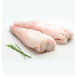
030773 * Rap Gran Sol cues sense pell 1,8/2,5 KGS. / PEÇA 20,50 €/ kg.