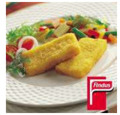
051000 * Lluç porcions 50 grs. MSC 5 KGS. COMPASS 8,60 €/ kg. 0,43 €/ unit.