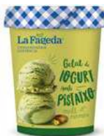
600667 logurt amb pistatxo