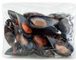
010585 * Musclo gallec 1/2 clova 60/90 3 KGS. I.Q.F. 8,70 € / kg.