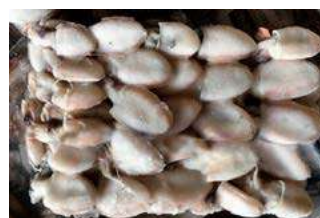
020736 * "Almendrita" Marroc 14 X 500 GRs. 6,70 € / kg.