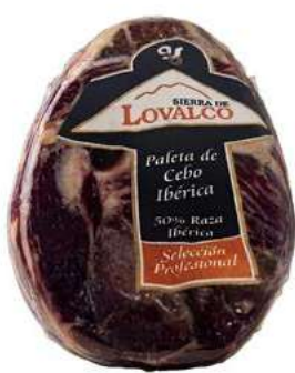
500609 Centre espatlla ibèrica Cebo selecció 6 X 2,5 KGS. SIERRA LOVALCO 33,64 €/kg.