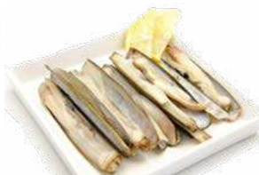
010593 * Navalles 11/13 cm. Holanda 5 KGS. 4,95 € / kg.