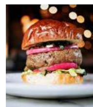
171573 * Hamburguesa Black Angus 27 X 170 GRs. BBQ VOLUTION 13,00 € / kg. 2,20 € / unit.