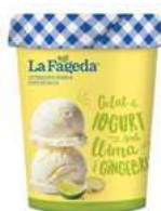
600668 logurt amb llima i gengibre