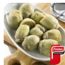
080830 * Carxofa cor 6 X 1 KG. FINDUS 10,25 € / kg.