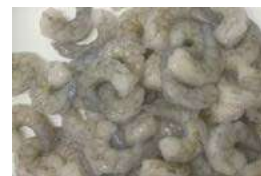
010610 * Llagosti Vannamei cua pelada i desvenada 16/20 10 X 800 GRs. 9,90 € / bossa