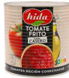
500204 Tomàquet fregit en oli oliva verge extra 6 X 3 KGS. HIDA 6,43 € / unit.