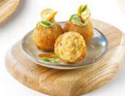
050360 * Croqueta mini "La del ajillo" 20 grs. 4 X 360 GRS. GASTROBAR 14,00 €/ kg. 0,28 €/ unit.