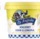
600671 logurt amb llimona 1,28 €/unitat