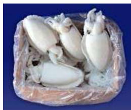
020709 * Sípia Marroc 300/400 grs. 6 KGS. I.Q.F. 10,75 € / kg.