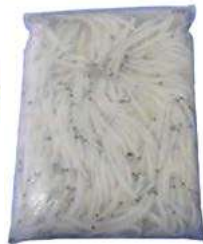
030859 * Xanguet 5/7 (peix platí) 24 X 250 GRS.(212 GRS. NET) 2,25 €/ unitat