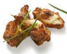
171518 * Aletes barbacoa 4 KGS. I.Q.F. BARNFIED 6,10 € / kg.