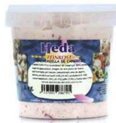
572651 Ensaladilla cranc 4 X 1 KG. HEDA 8,35 € / unit.