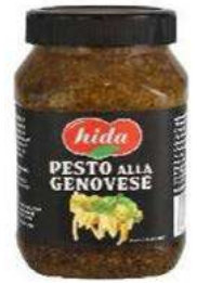
500231 Pesto alla genovese 6 X 900 GRs. HIDA 7,19 € / unit.