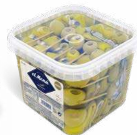
519032 Gildes de seït en oli 6 X 36 UNITS. EL MENÚ 15,90 €/unit.