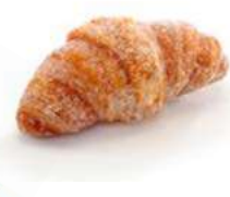
105124 * Xuixo petit de crema 33 X 51 GRs. 14,85 € / caixa 0,45 € / unit.