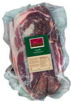
504025 Centre espatlla duroc 50% G.R. selecció 4 X 2,5 KGS. PRODAL 17,32 €/kg.