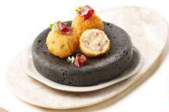
050358 * Croqueta mini "La Ibérica" 20 grs. 4 X 360 GRS. GASTROBAR 14,00 €/ kg. 0,28 €/ unit.