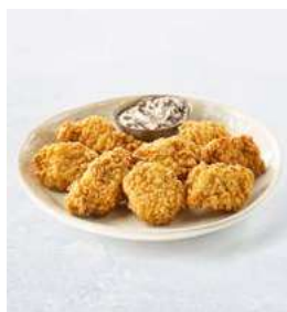
050362 * Pollastre pit Crunchy Kentucky 17/25 grs. 10 X 400 GRs. PRIELA 10,50 € / kg.