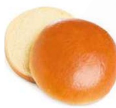
100037 * Pa d'hamburguesa brioix pretallat 20 X 85 GRs. BELLSOLÀ 13,60 € / caixa 0,68 € / unit.