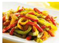
081004 * Pebrot tricolor juliana rostít 6 X 1 KG. FINDUS 4,95 € / kg