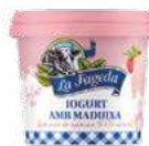
600672 logurt amb maduixa 1,28 €/unitat