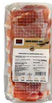
504026 Pernil llescat duroc especial entrepans 4 X 300 GRs. PRODAL 8,19 €/unit.