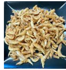
050300 * Gamba cristall enfarinada Gourmet 14 X 250 GRS. FROXA 2,50 €/ unitat