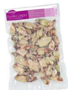
020830 * Puntilla sense pluma 450 grs. (env. al buit) 12 X 450 GRs. MARINES 3,30 € / bossa