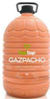
500290 Gaspaxo tradicional 3 X 5 LITRES TAP TAP 2,39 € / litre