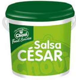
512108 Salsa cèsar 4 X 2000 ML. CHOVI 5,20 € / litre