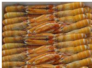
010511 * Escamarlà n° 2 16/20 Extra 4 X 1,5 KGS. 16,90 € / kg.