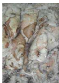
020710 * Calamar C-0 França bloc +1000 grs. (10% GLAÇ) 10 KGS. 12,70 € / kg.