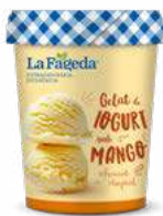
600669 logurt amb mango