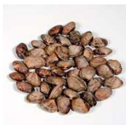
010517 * Cloïssa japònica negra 60/80 6 X 1 KG. 9,80 € / kg.