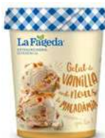
600683 Vainilla i nous macadàmia